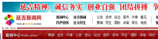
新闻中心 News center 要闻 延吉 外埠 公告 言论 延边 县市 吉林 民生 国际 体育 娱乐 社会 民生 要闻 民生 国际 体育 娱乐 社会 民生