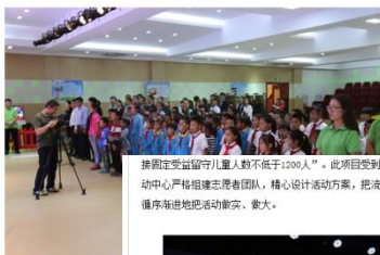
接固定受留守儿童人数不低于1200人”。此项目受到了市教育局的 动中心严格组建志愿者团队，精心设计活动方案，把流动少年宫活动 循序递进地扎实开展、做大。