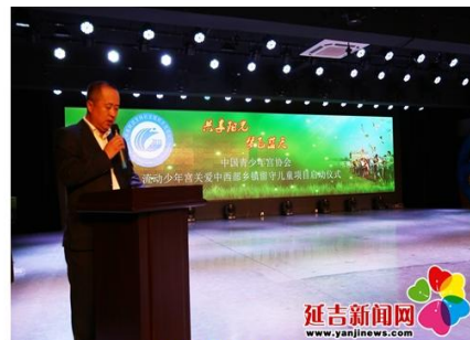
主持人介绍活动主旨

延吉新闻网9月19日讯（记者 韩丹）9月19日，延吉市“共享阳光 梦飞蓝天”流动少年宫启动仪式在延吉市青少年活动中心举行，标志着关爱中西部乡镇留守儿童项目正式启动。