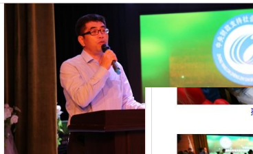
教育局领导宣布“流动少年宫