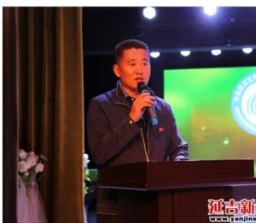
乡镇负责人发言