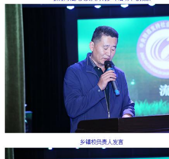
乡镇校负责人发言