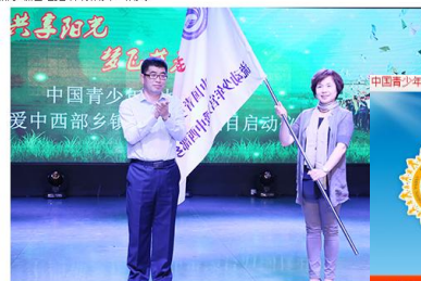
教育局相关负责人为青少年活动中心授旗