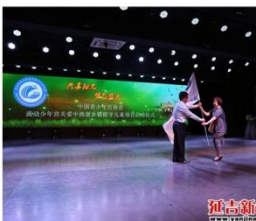
教育局相关负责人为青少年活动中心授旗 韩丹