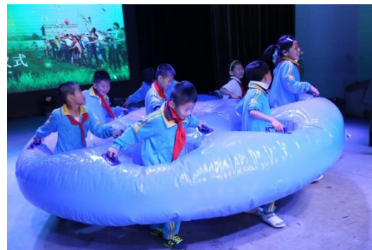
强渡金沙江(八仙过海)