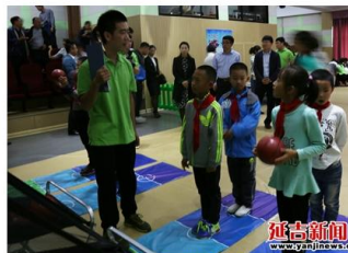
孩子们正在进行体验活动