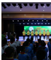
志愿者与同学们见面