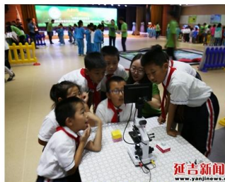
孩子们正在进行体验活动