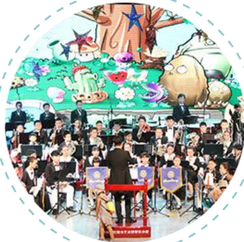
红领巾艺术团周年音乐会