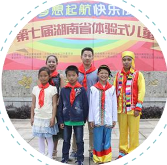
湖南省体验式儿童节