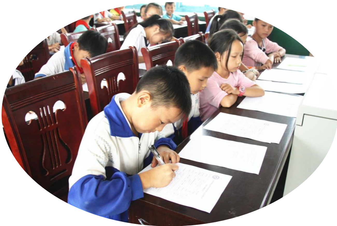
认真填写调查问卷

活动结束后，孩子们纷纷表示这次活动非常有趣，让他们学到了很多新奇的知识，同时也懂得了与同学之间要互相配合，互相谦让，这次活动在他们的心里留下了美好的回忆。学校教师说，很少看到孩子们这么活泼活跃的样子，希望以后还能开展类似的活动。“流动少年宫”将三个活动项目器材赠予北岗完小，希望活动器材丰富孩子们的课余生活，充实孩子们的精神世界，陪伴他们健康快乐地成长。