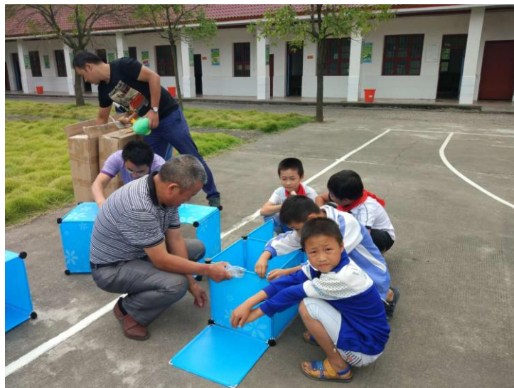
指导孩子组装愤怒的小鸟