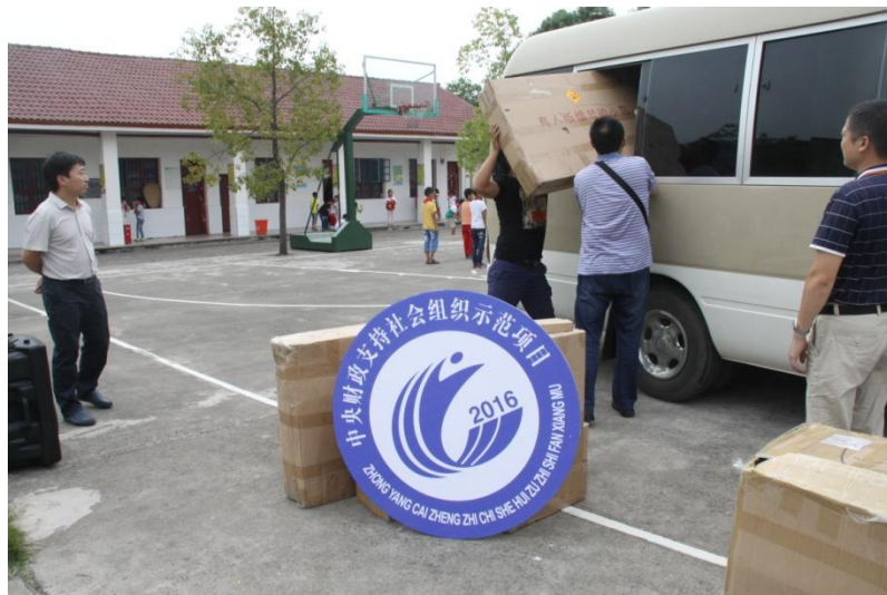
到达现场装卸器材

9月20日，活动当天秋高气爽，湖南省青少年活动中心“流动少年宫关爱中西部农村留守儿童项目”活动组来到了张家界慈利县北岗完小，我们送去的游戏器材是体感游戏、赛车和愤怒的小鸟，一起要做2场活动。