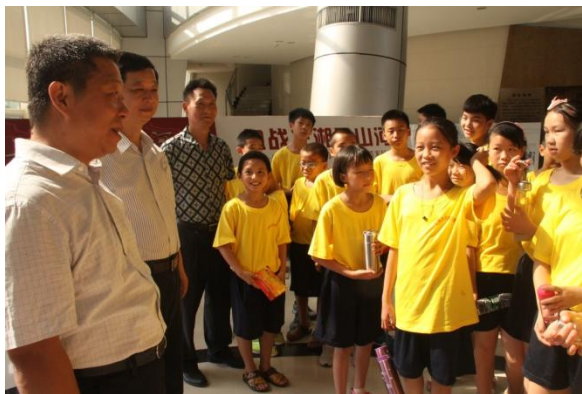
红领巾示范夏令营

夏令营活动从2013年开始举办，已办4期，参与人数达20000余人。夏令营围绕少年儿童暑假生活，将趣味性、挑战性、实用性和教育性融为一体，通过参观学习、劳动体验、团队拓展等方式，让广大少年儿童在活动中磨练意志、挑战自我、团队协作、学会宽容。教育引导青少年从小立志向、有梦想，做爱学习、爱劳动、爱祖国的好少年。