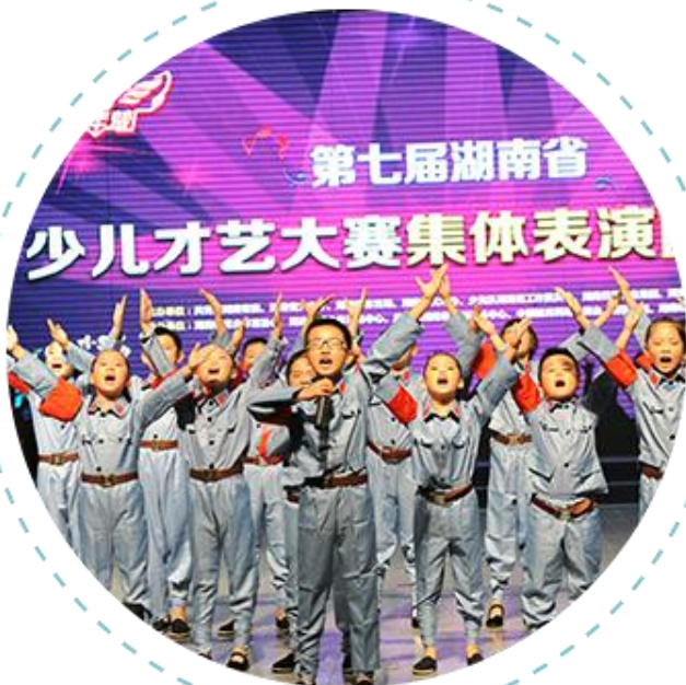
湖南省少儿才艺大赛