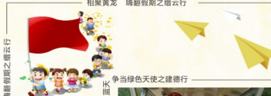
争当绿色天使之建德行