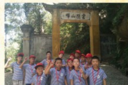
相聚黄龙 嗨翻假期之缙云行