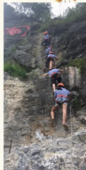
碧水蓝天 争当绿色天使之建德行