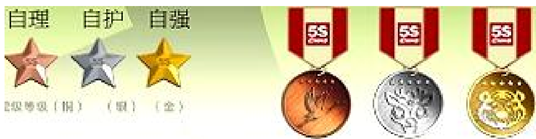
图 3: 肩章星及勋章图

荣誉勋章: 荣誉勋章如图 3 是营地挑战活动最荣誉。自理勋章、自护勋章、自强勋章。队员通过技能挑战取得相应类别的五颗星后，即可摘得相应类别的勋章，成为营地争章挑战胜利者！