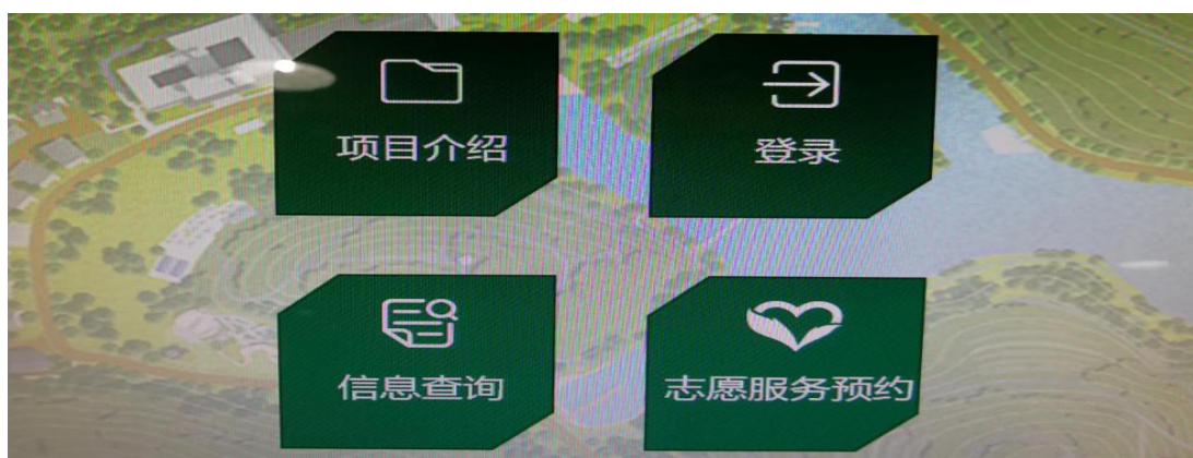
图 5：自主终端预约界面

（2）系统管理增加学员自主选择。每一名队员有独立的信息服务终端，志愿服务必须同自助预约才能获得，引导队员主动参与志愿服务，时刻挂念志愿服务成为营地志愿服务评价的亮点，通过将志愿服务的时间与荣誉或者争章体系挂钩的形式，将志愿服务从被动选择转变为主动参与。通过调查发现普遍存在学员志愿服务时间多于营地规定的志愿服务时间，由此可见通过“要求+引导+自主选择”的志愿服务评价管理模式能够更加有效的提升队员志愿服务的积极性。