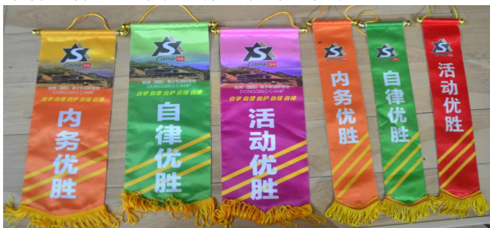
图 1: 营地优胜锦旗

集体活动素养评价。营地是以集体活动为主要活动形式，通过集体生活和集体管理，增加队员之间的交流与接触，磨合彼此之间差异，挑战队员的适应能力。为突出团队评价营地设置了三类优胜锦旗如图 1:自律优胜锦旗、活动优胜锦旗和内务优胜锦旗，这三面锦旗主要是对针集体对队员的自律情况、参加活动的情况、以及寝室内务的整理情。对小队、中队进行集体打分评价并评出优胜锦旗的小队和中队。要简单讲一讲三面锦旗具体包含那些内容。