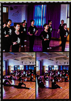
宝山区舞蹈共同体

最后,各共同体学校就本学期舞蹈社团活动的开展情况进行了总结汇报。大家在交流中提高,总结中展望,期待着下学期舞蹈共同体活动的积极开展。