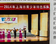
梦想的乐章——2014年上海市青少年特色乐队展演