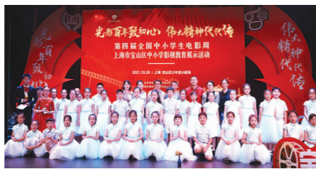
“小陶子秀”三个板块,结合宝山区中小学生学习主题手绘作品集、影视主题讲演、微电影作品等内容进行了现场展示。

宝山的小陶子们走进党史教育基地,走近烈士丰碑,拍摄并制作了走进场馆的宣讲视频,创编并排演党史故事。来自上海大学附属学校、宝山实验学校、上海大学附属中学的同学们分享的三个党史故事,具有感染力的现场讲演激起了师生们的一片共鸣。 本次展示活动特精选了三部荣获全国中小学生微电影大赛提名奖及等第奖的作品进行现场展播,其中行知中学的《“VC”那点事》、菊泉学校的《一枚党员徽章》及罗店中心校的《自梦》,三部作品各具特色,风格迥异,学生从不同视角展现出了对亲情、友情、师生情的表达。