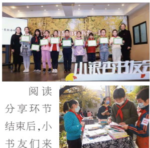
阅读分享环节结束后,小书友们来到银杏树下,跟伙伴们交换好书,一起欢乐合影。

爱阅读的孩子们分享了选书、读书、聊书的过程中值得关注的好方法。她建议同学们在阅读过程中把读过的书记录下来,给同学一起分享。她说,阅读的过程中一定要有输出,思考和分享都很重要,而“小银杏书友会”就是一种很好读书分享的形式。