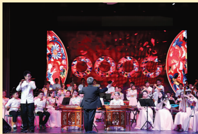
我区12所非遗传承学校搭建展台,现场展示各自的传统文化项目,优秀作品琳琅满目,令人目不暇接;互动体验活动,不仅让参与者感受优秀传统文化的魅力,更激发着每个参与者的兴致。

下午两点,宝山区学生民族文化培训活动推进会准时在小剧场拉开帷幕。会上,回顾了宝山区学生民族文化培训活动历程;交流