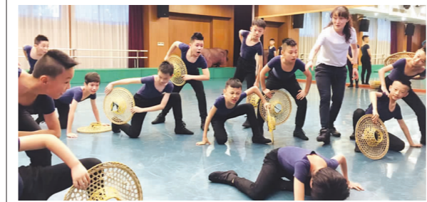
宝山区舞蹈共同体教师观摩仲盛舞蹈团教学活动

“梅花香自苦寒来”,相信舞蹈共同体的老师们在专家团队的引领下,在各自的努力实践下,一定会不断进取,提高舞蹈教学水平!