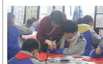
宝山区百名书法教师培训三年跟踪活动在馨家园学校正式启动

为了进一步推进区域整体书法教育,自2016年起,开展了宝山区百名书法教师培训活动。两年来已有94所学校,166人次参加了培训。学员在具有针对性的指导下,个人书法撰写水平都有不同程度