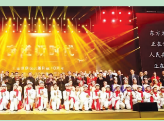
宝山区百名书法教师培训三年跟踪活动在馨家园学校正式启动

通过一次次成功的演出,宝山区少年宫艺术语言社团的孩子们的表演技艺越发成熟,在市、区级的舞台上不断散发着自信、闪亮的光彩。